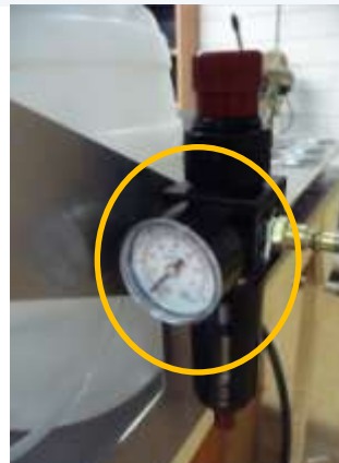
Hotfog RLVM 5 bar