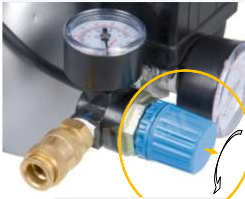
Compressor 7-8 bar

Breng de druk omhoog of omlaag door de knop van het reduceerventiel eerst iets omhoog te trekken voordat u aan de knop draait.