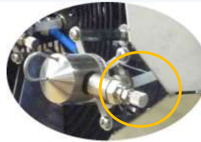
Helemaal open draaien

Controleer de naaldafsluiter aan de voorkant van de RLVM. Voor het vernevelen van kiemremmers draai de afsluiter zo ver mogelijk open. Één sproeier geeft niet meer dan 3 liter per uur. En wanneer nodig iets dichter draaien.